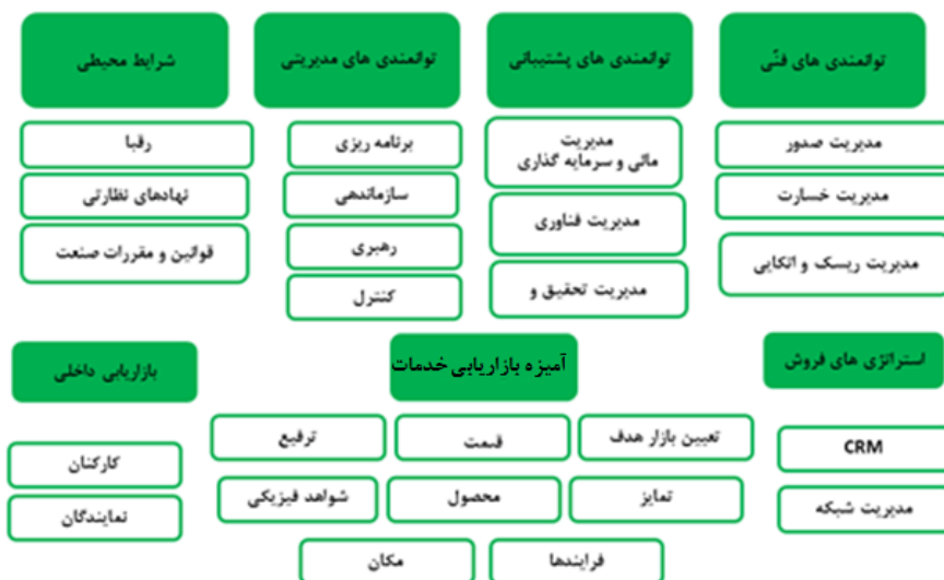
نمودار (۳). مدل برندسازی شرکتهای بیمه بازرگانی