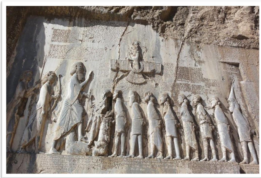
تصویر شماره ۲- سنگ نگاره بیستون- (رف، ۱۳۹۵: ۱۲۹)