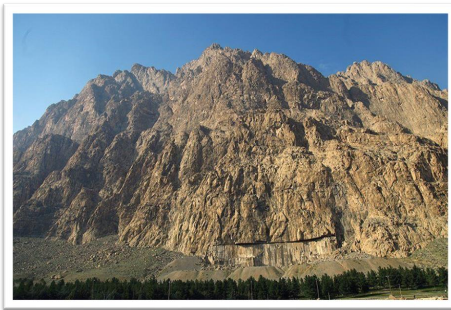
تصویر شماره ۱- کوه بیستون- (فرزاد منتی)

پانوفسکی در کتاب "مطالعاتی در شمایل نگاری" شمایل نگاری را در سه گام توضیح می دهد: توصیف پیشاشمایل نگارانه، تحلیل شمایل نگارانه و تفسیر شمایل شناسانه. پانوفسکی در مرحله اول به توصیف صرف تصویر می پردازد و خط، سطح، حجم و معانی ناظر به واقع و معانی درونی - حسی را بیان می کند. لایه اول که مربوط به معنای ابتدایی یا طبیعی پدیده‌هاست به دو قسمت معنای واقعی و بیانی تقسیم می شود. او نام این مرحله را «توصیف پیشاشمایل نگارانه» گذاشته است. مرحله و لایه دوم