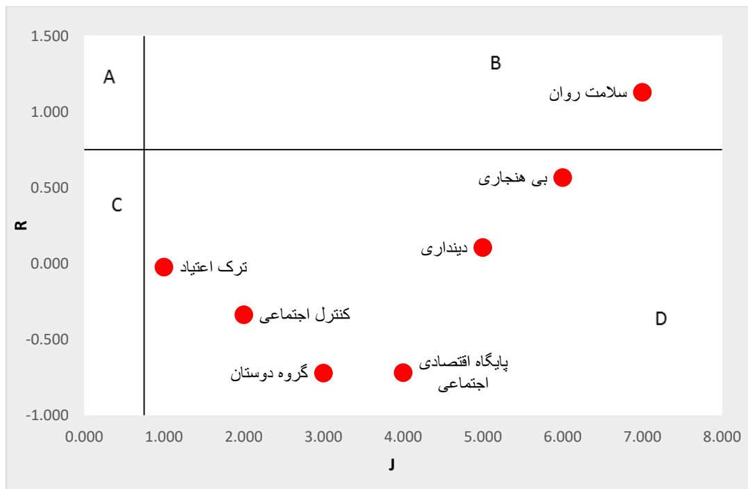
نمودار ۲- ماتریس اثرپذیری عوامل مؤثر بر ترک اعتیاد

ملاک و مبنا در تحلیل فوق، برآیند اثرگذاری - اثرپذیری (R-J) بود. نویسندگان در یک تحلیل تکمیلی مازاد بر روش دیماتل، از تحلیل ماتریس اثرگذاری - اثرپذیری استفاده کرده‌اند. در این تحلیل، دو معیار اثرگذاری (R) و معیار اثرپذیری (J) به صورت جداگانه مبنا قرار می‌گیرد. بعد عمودی ماتریس، به اثرگذاری عامل (R) و بعد افقی ماتریس، به اثرپذیری عامل (J) اشاره دارد. خط تفکیک‌کننده خانه‌ها در هر دو بعد، میانگین R و J است که با هم یکسان بوده و برابر با میانگین R یا J است. بر این اساس، چهار طبقه از عوامل را بر برآیند اثرگذاری اثرپذیری می‌توان تشخیص داد: