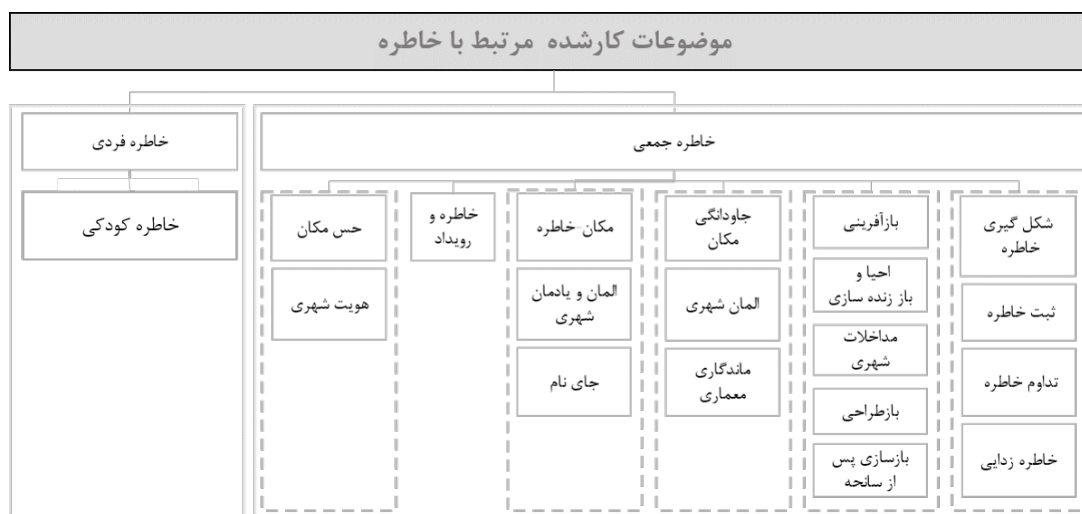
نمودار شماره ۳: موضوعات و اهداف کارشده مرتبط با موضوع خاطره

شده‌است. در سایر مطالعات، تعدادی مؤلفه انتخاب و در بستر مورد نظر بر مبنای سایر متغیرها، بررسی شده است.