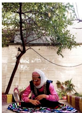
تصویر ۸. چرخش دست‌ها به صورت حلقه