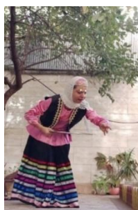
تصویر ۵. پاشیدن بذر در مرحله کاشت