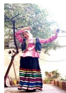
تصویر ۴. رقص با زیل (سنج)