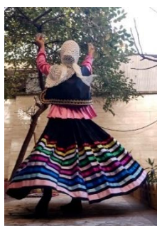
تصویر ۳. رقص با لیوان

نیاکان خویش (مسلمان کردن فرزند) و شادمانی افراد حاضر در ضیافت می‌رقصند (لنگرودی، ۱۳۹۸: ۳۵).