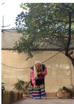
تصویر ۹. کندن علف در مرحله داشت، عکس‌ها: نگارندگان