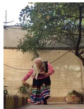
تصویر ۷. برش در مرحله برداشت