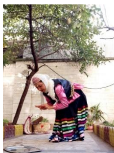
تصویر ۶. کاشتن بذر در مرحله کاشت