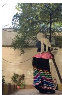
تصویر ۲. ضرب باسن با بشکن