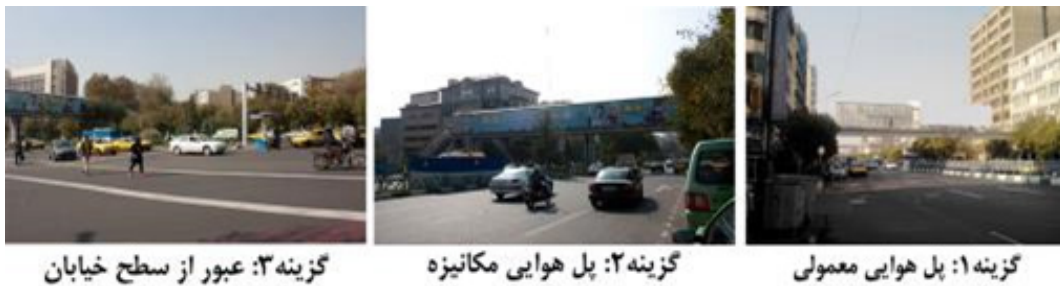
گزینه ۱: پل هوایی معمولی گزینه ۲: پل هوایی مکانیزه گزینه ۳: عبور از سطح خیابان

تصویر ۲ موقعیت سه گزینه مورد نظر سنجش را در کنار یکدیگر نشان می‌دهد.