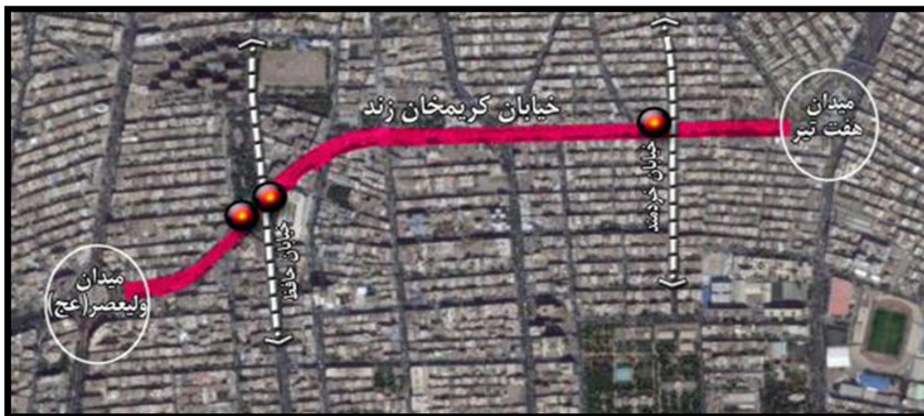
تصویر شماره ۱: موقعیت قرارگیری نمونه مورد مطالعه

نمونه مورد مطالعه این پژوهش، خیابان کریمخان زند تهران واقع در منطقه ۶ شهرداری انتخاب شده است. این منطقه به دلیل استقرار در مرکزیت جغرافیایی شهر تهران به عنوان استخوان بندی شهر تهران و مرکز نقل جدید حکومتی، اداری و تجاری ایفای نقش می‌کند (Naghsh-e-Jahan Pars Co., 2007). خیابان کریمخان زند محور پیونددهنده دو مرکز هسته‌ای کار و فعالیت یعنی میدان هفت‌تیرو میدان ولیعصر در جهت شرقی-غربی است که با وجود کاربری‌های اداری-خدماتی در سطح فرامنطقه‌ای، تردد بالایی پیاده و سواره در آن به وقوع می‌پیوندد اما مدت‌هاست که اولویت حرکت در اختیار وسایل نقلیه قرار گرفته و سبب گرایش به راه‌حل