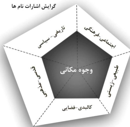
تصویر شماره ۴: مدل تحلیلی پژوهش؛ نام مکان‌ها و بازنمای شخصیت شهر اردبیل

با این‌که دیدیم در برخی موارد تحلیل از نام‌های مکان‌ها حتی از روند شکل‌گیری مکان تا ویژگی شکل و فیزیک شهر و روح آن را حکایت می‌کند، اما دسته‌بندی نام‌ها در قالب کلان مشخصه‌ها و مؤلفه‌های مکانی نشان می‌دهد که اشارات سمبلیک نام‌ها در شهر اردبیل نه صرفاً در توجه به کمیت نام‌ها بلکه با نگاه به کیفیت، درجه اهمیت، تأثیرگذاری آنها و انتقال کلان روایت‌های موجود در پس پیام آنها، میل بیشتر و نیرومندی به بازنمای شخصیت قدسی- مذهبی شهر در عین همراهی سایر مشخصه‌ها دارد (تصویر شماره ۴).