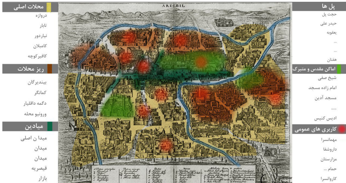
تصویر شماره ۳: نام مکان در نقاشی تاریخی شهر