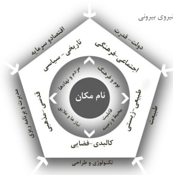
تصویر شماره ۲: مدل چارچوب مفهومی؛ نام مکان برآیند فرآیندهای مختلف و بازنمای مشخصه مکان