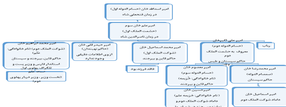
شکل شماره (۱): دودمان خزیمه علم ۳ از زمان فتحعلی‌شاه تا انقراض.

در شکل شماره (۱) دودمان خاندان «علم» از سلطنت «فتحعلی‌شاه» تا زمان انقراض ترسیم شده- است.