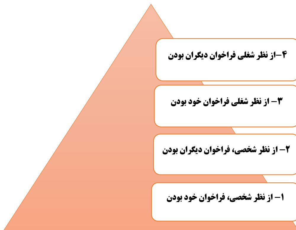
شکل ۲. ابعاد اصلی نظریه فراخوانی

در این پژوهش به صورت ویژه به چهارمین بعد اصلی نظریه فراخوانی، (از نظر شغلی فراخوان دیگران بودن)، که نقش معلم را به عنوان معلم فراخوانی به وضوح به تصویر می کشد، می پردازیم (شکل ۲). در این نظریه، به صراحت بیان می دارد، معلم فقط تسهیل گر و مشارکت کننده است که همراه با دانش آموز حرکت می کند ولی دستوردهنده نیست (Joyce, 2013). وظیفه اصلی معلم فراهم نمودن محیطی باز و با اعتماد در کلاس درس، و پس از آن کمک به پیشرفت دانش آموزان در رسیدن به اهداف یادگیری است (Miller, 2015). معلم نسبت به اظهار نظرهای جدید با خوشرویی برخورد می کند، در این صورت، خود نیز یک یادگیرنده است (Miller, 2015). از روش های فعال تدریس استفاده می کند و دانش آموز را در فرایند یاددهی-یادگیری درگیر می کند (Joyce, 2013).