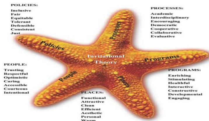
شکل ۱. مدل ستاره دریایی برای توصیف آموزش فراخوانی

در این مدل برای هر یک از مؤلفه‌ها، ویژگی‌هایی نیز ذکر شده است. مکان‌ها باید جذاب، مرتب، گرم، شاد، زیبا کارآمد، ترغیب‌کننده و کاربردی باشند. خط‌مشی‌ها باید شامل توجه، پذیرش، تأیید دوباره، تشویق، نمره‌گذاری، نظم، درجه‌بندی و شناسایی باشند. افراد نیز باید این خصوصیات را داشته باشند: اعتماد، توجه به همه، احترام، خوش‌بینی، در دسترس بودن، ادب و نیز مراقب بودن. برای برنامه‌ها نیز به ویژگی‌هایی از جمله کمک به همسالان، مشارکت جامعه و اولیاء، تدریس برای قبولی، تمرکز کافی و غنی‌سازی فرصت‌ها اشاره شده است. فرآیندها نیز باید بر مواردی چون جهت‌گیری تحصیلی، مهارت‌های بالای تفکر، روش‌های مشارکتی، تعامل جمعی، فرصت‌های ارزشیابی و روحیه دموکراتیک تأکید کنند.