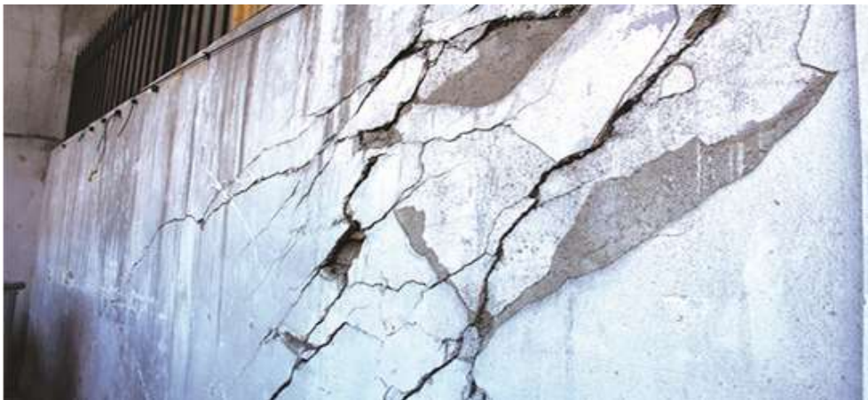
تصویر ۳. نمونه‌ای از دیوار ترک‌خورده‌ی ساکنان محله بافت فرسوده بریانک بر اثر احداث مترو