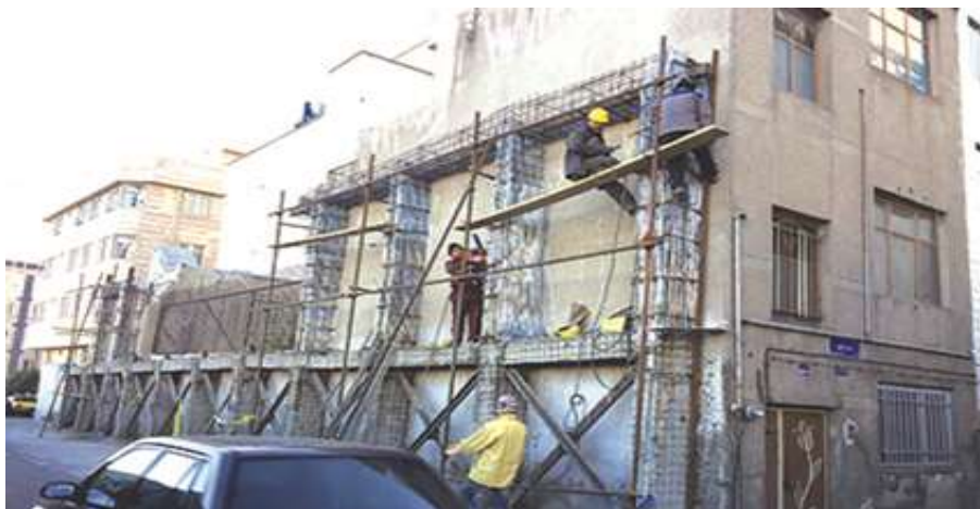
تصویر ۵. نمونه‌ای از بافت‌های فرسوده خریداری شده محله بریانک در حال مرمت