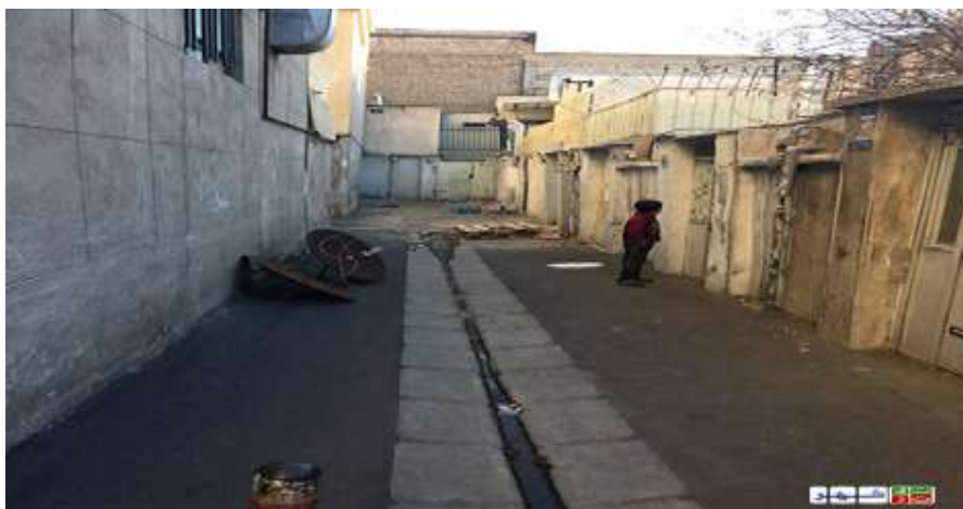
تصویر ۴. نمایی از کوچه‌های تنگ و باریک محله بافت فرسوده بریانک

شاهد (۱): اگه توی خود محله ما امکانات ورزشی، فرهنگی و... لازم داشتیم دیگه لازم نبود من کلی وقتمو هدر بدم تا با کلی انتظار از محله خارج بشم و به مکان مورد نظرم برسم، توی این محل، حتی پارک درست حسابی نداریم. چند تا بوستان هستن فقط. شاهد (۲): ۶۰ سالی میشه این محله به حال خودش رها شده. از اولم زیرساخت چندان مناسبی نداشت. یه چندتا باشگاه و کلاس زبان و مدرسه و... بودش که اونم به مدد اجرای طرح نواب و مترو قشنگ شدن پاتوق اوباش.