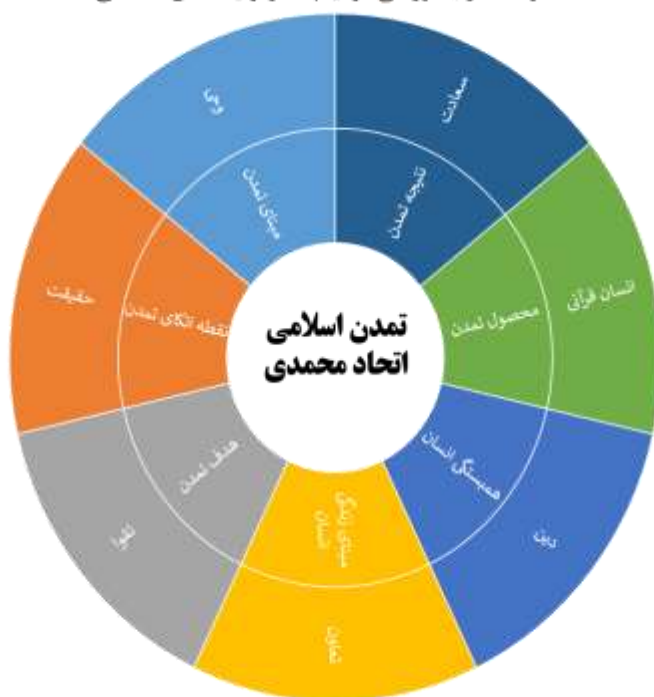
منظومه فکری نورسی برای پایه ریزی تمدن اسلامی