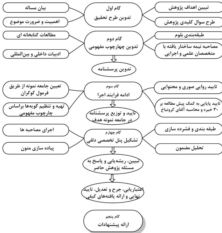
شکل (۱): مدل مفهومی اجرای پژوهش